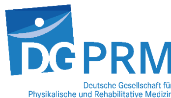
Deutsche Gesellschaft für Physikalische und Rehabilitative Medizin e.V. (DGPRM)