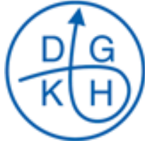
Deutsche Gesellschaft für Krankenhaushygiene e.V. (DGKH)

Diese Stellungnahme wurde von Vertretern der DGKH und der DGKJ initiiert und von der AWMF und den weiteren aufgeführten Fachgesellschaften (insbes. DGEpi) finalisiert. Alle aufgeführten Fachgesellschaften unterstützten diese Stellungnahme (Ansprechpartner siehe Schluss).